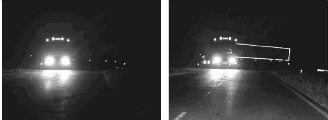
Figuur 2 – Manoeuvrerende truck met oplegger (achteruit instekend in een oprit), zoals gezien door tegemoetkomend verkeer; met alleen zijmarkeringslichten (links) en met additionele contourmarkering (rechts) (Alferdinck e.a., 2003).

de retroreflecterende berm paaltjes. Ondanks het feit dat de lichten op meer dan een halve kilometer zichtbaar waren (bij nat weer 300 m) werden ze niet herkend als een deel van de oplegger. Het tegemoetkomend verkeer zag een truck met een normale snelheid vooruit reed en had niet door dat deze daarentegen langzaam achteruit manoeuvreerde en deels schuin over de weg stond. De verkeerssituatie werd pas correct ingeschat op een fataal korte afstand (25–50 m). Door de oplegger te voorzien van contourmarkering (ECE 104, klasse C, 5 cm breed) werd deze herkend op veilige afstanden van enkele honderden meters, in droge en natte weersomstandigheden.