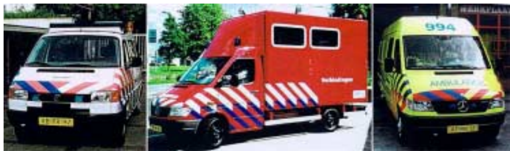
Figure 3 – Voertuigen van politie, brandweer en ambulance in de uniforme striping (Alferdinck e.a., 1999).

In de vorige rapportage TNO-TM98 is niets gezegd over de striping van voorrangsvoertuigen, omdat we ons toen beperkt hebben tot de waarschuwinglichten. Toch is striping algemeen gebruikelijk bij de Nederlandse hulpvoertuigen. Als bij de striping fluorescerend en retroreflecterend materiaal gebruikt wordt dan is het mogelijk om de opvallendheid van een voertuig zowel overdag als 's nachts te waarborgen. Door BZK is een uniforme striping voorgeschreven waarbij elk hulpdienst herkenbaar is aan een eigen grondkleur; wit voor politie, rood voor brandweer en geel voor ambulance (Fig. 3). Een eigen kleur voor elk type hulpdienst maakt met name de coördinatie van de hulp bij rampen e.d. gemakkelijker.